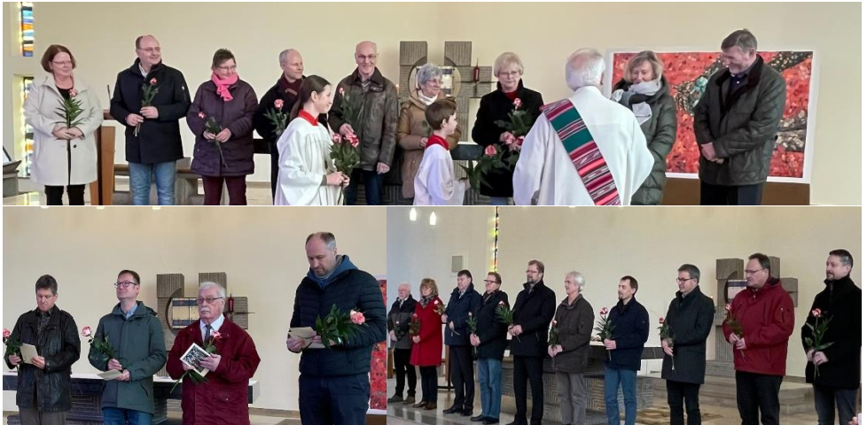
Oben: Der neu gewählte Pfarrgemeinderat; Links: Die ausgeschiedenen Mitglieder des Kirchenvorstands; Rechts: Der neu gewählte Kirchenvorstand (jeweils soweit anwesend)

Auf der nachfolgenden Seite sind die Namen der Mitglieder des KV u. PGR aufgeführt.