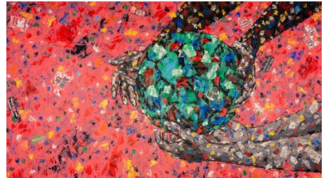
Das Misereor-Hungertuch 2023 „Was ist uns heilig?“ von Emeka Udemba © Misereor

Wird sie kippen wie unser Klima? Die Erdkugel, gute Schöpfung und Heimatplanet oder Spielball verschiedener Interessen?