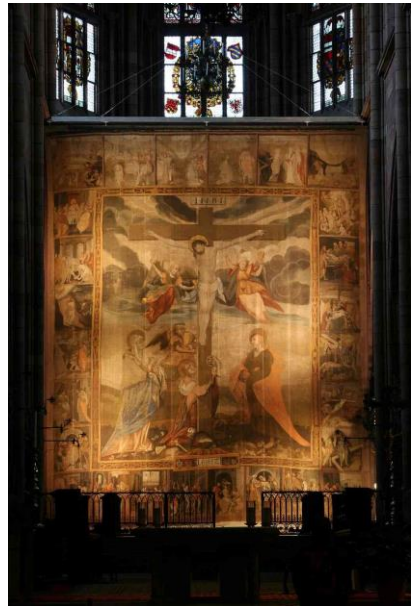
Freiburger Fastentuch

geht auf den jüdischen Tempelvorhang zurück. Im Evangelium wird vom Zerreißen des Vorhangs im Tempel in dem Moment berichtet, als Jesus am Kreuz stirbt. Als Beispiel ist das größte noch erhaltene ca.10x12m große Freiburger Fastentuch von 1612 zu nennen. In unserer Kirche wird diese Tradition durch das Verhüllen des Kreuzes mit einem violetten Tuch fortgeführt.