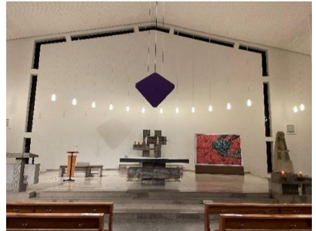
St. Bernward Gr.-Ilsede an Aschermittwoch mit dem neu aufgestellten aktuellen Hungertuch